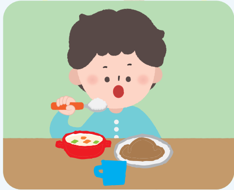
스스로 밥 먹기