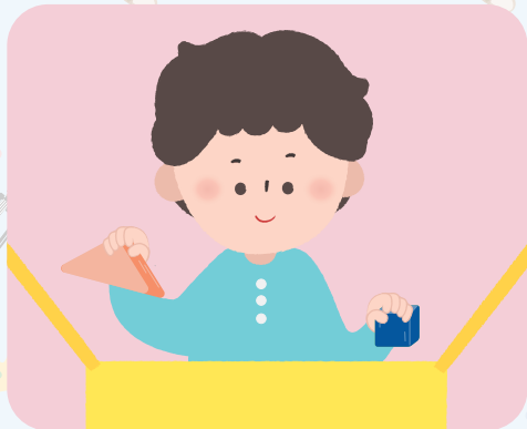
스스로 장난감 정리하기